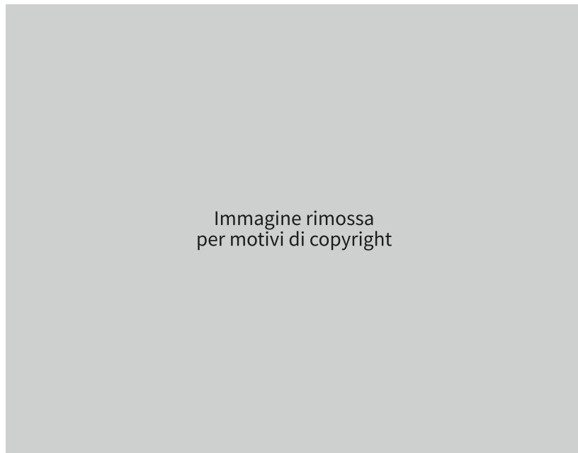
Immagine rimossa per motivi di copyright