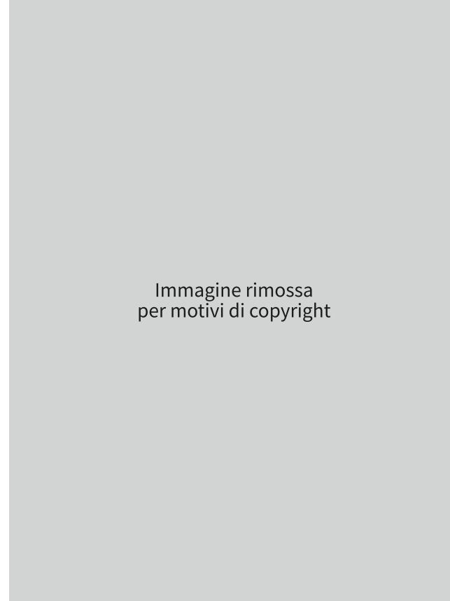
_____ fig. B William Morris ritratto da Frederick Hollyer

Immagine rimossa per motivi di copyright