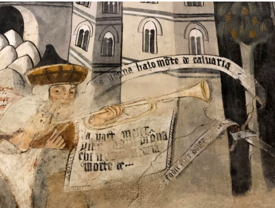
Fig. 1: San Fiorenzo di Bastia, Passione, affresco, 1466, particolare («Il banditore e la vergine»).