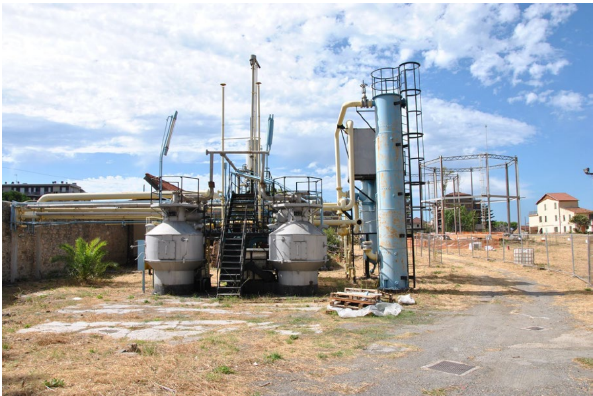
Fig. 1. Ex Officine del Gas di Ventimiglia, Ventimiglia (foto di F. Pompejano, 2025).

L’evoluzione concettuale si salda con l’idea di patrimonializzazione come costruzione sociale e si inserisce nell’enfasi partecipativa che attualmente caratterizza la sfera pubblica. L’invito, per chi progetta la conservazione e la messa in tutela, è quello di considerare la patrimonializzazione non come un esito automatico, ma come un processo da governare criticamente, pena la riduzione del patrimonio a risorsa retorica o meramente economica. Un recente esempio, attualmente ancora in corso di realizzazione, è quello riferito alle ex Officine del Gas di Ventimiglia 9 (Fig. 1) le cui vestigia insistono su un’area archeologica romana determinando un insieme pluristratificato di grande impatto emotivo.