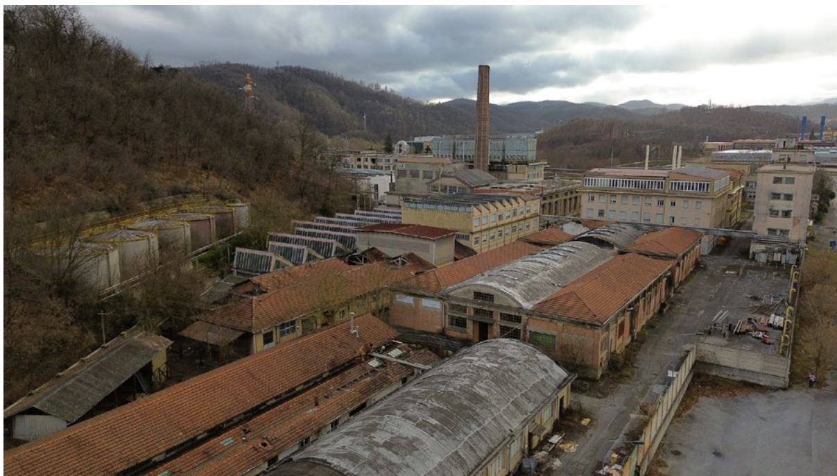
Fig. 3 Ex Stabilimento industriale Ferrania-3M, località Ferrania, Cairo Montenotte

L'analisi storica e critica della tradizione conservativa, da Jukka Jokilehto 14 a Miles Glendinning 15 , può essere assunta come fondale o faro per orientare pratiche di conservazione e di riuso coerenti e compatibili, distinguendole da strategie opportunistiche e rendendo esplicite le scelte di intervento in relazione al valore poliedrico del patrimonio industriale ma anche i compromessi con la pianificazione e lo sviluppo del territorio.