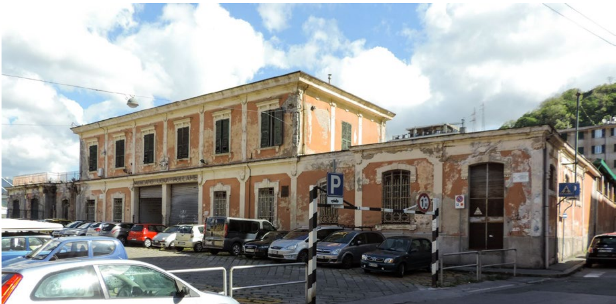
Fig. 2. Ex mattatoio di Genova-Campasso, padiglione di testa dei primi del Novecento, prima dell’intervento di riuso del complesso che ne prevede la parziale conservazione (foto di R. Vecchiattini, 2017).

Nel considerare i paesaggi e le architetture industriali, l’espansione dell’oggetto/concetto patrimonio si confronta sovente con esplicite conflittualità tra valori culturali, interessi economici e aspettative sociali delle comunità e delle istituzioni locali. Il caso genovese dall’ex mattatoio di Genova Sampierdarena (Fig. 2), trasformato in scuola d’infanzia, supermercato e palestre 11 , mostra come l’attribuzione di valore possa essere contesa e talora piegata a finalità estranee alla conservazione 12 . Allo stesso modo, il caso dell’ex sito industriale di prodotti fotosensibili in località Ferrania, Cairo Montenotte (Fig. 3), nell’entroterra savonese, mostra come il vincolo architettonico puntuale – che è stato adottato in una fase avanzata di dismissione, quale misura d’urgenza per contenere le prime demolizioni – se da una parte ha assicurato la sopravvivenza per interesse culturale di alcuni importanti edifici dell’ex stabilimento, dall’altro ha paradossalmente generato squilibri e ambiguità, risultando un presidio necessario ma non sufficiente, quasi simbolico 13 .