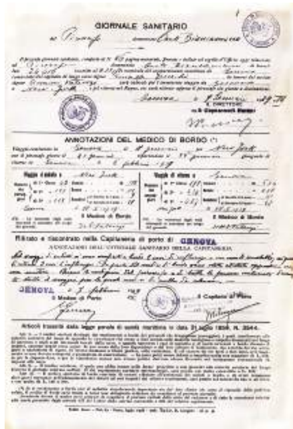
Figura 6 Giornale sanitario relativo al viaggio Genova-New York (11-21 gennaio 1929; 26 gennaio-6 febbraio 1929). Il documento riporta il numero di passeggeri distinti per classe, uomini, donne e bambini. ACS, MIDGS, Giornali sanitari , b. 19

Il fascismo prova a demolire gli stereotipi xenofobi e antitaliani e a invertire sentimenti italo-fobi radicati negli Stati Uniti enfatizzando il valore dell'italianità e, a partire dal 1927, promuovendo iniziative che incentivino partenze dall'Italia qualificate a scapito di quelle ritenute non qualificate che avevano caratterizzato il fenomeno di mobilità fino ad allora. Parallelamente il regime sostiene il Commissariato generale dell'emigrazione con la Direzione generale degli italiani all'estero, con l'obiettivo di avere maggiore controllo delle comunità italiane all'estero e trasformarle in strumenti della propria politica (Pretelli 2004). Tra le armi introdotte dal regime anche l'informata di nuovi funzionari diplomatici che proprio a partire dal 1927 è assegnata alle sedi all'estero. Si trattava - a leggere le dichiarazioni più vicine al regime - di «giovani dotati di una sana cultura, competenti, distinti di carattere, affabili di modi, fedelissimi al Regime» (Pretelli, Ferro 2005, 122).