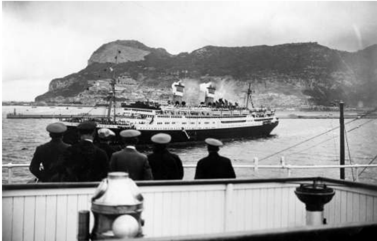
Figura 1 Il Conte Rosso incrocia il Conte Biancamano all'ingresso nel Mediterraneo dopo la traversata oceanica. A bordo, Balbo e i suoi aviatori tornano in Italia dopo la trasvolata atlantica Italia-Brasile. 1931.