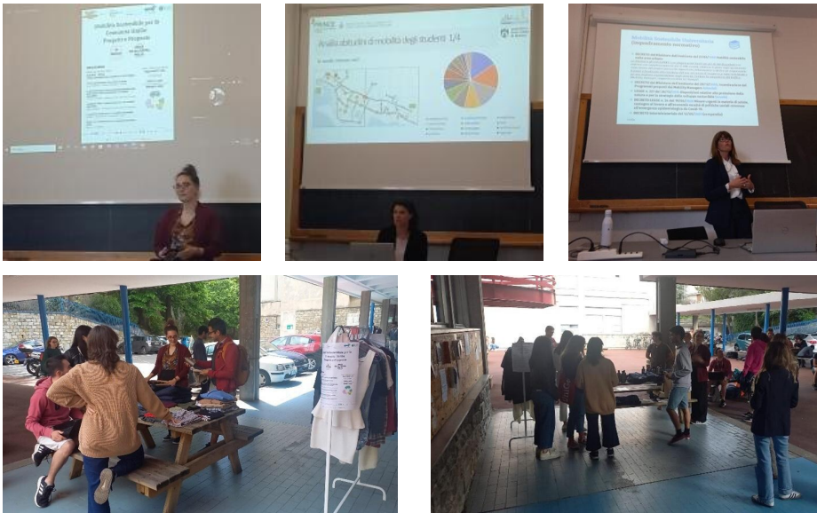
Figura 3- Evento Mobilità sostenibile, Car-sharing ed economia circolare per la comunità UniGe.

Il primo, “ PRINCE Eco-Tour in UniGe ”, è stato programmato nell’ambito della European Mobility Week 2023 , il 22 settembre, ma è stato poi rimandato al 29 settembre causa allerta meteo ( https://unigesostenibile.unige.it/ PRINCEEcoTour , Fig.4). I partecipanti, oltre 80 tra studenti e studentesse, si sono spostati tra i vari poli con mezzi sostenibili (trasporto pubblico locale, car sharing , bike sharing , a piedi) ottenendo ad ogni tappa diversi buoni di mobilità. È stato poi previsto a fine del percorso un momento finale, un World Café con buffet offerto, dove attraverso game e piattaforme interattive si è ragionato assieme sulle principali barriere riscontrate durante i percorsi con i mezzi pubblici e quali drivers potrebbero incentivare il loro uso. È stato chiesto ai partecipanti di rispondere ad alcune domande per raccogliere il loro punto di vista e i vari partners di progetto hanno avuto l’occasione di presentare i risultati del progetto PRINCE e di illustrare le opportunità di scontistica previste per la fascia under 26.