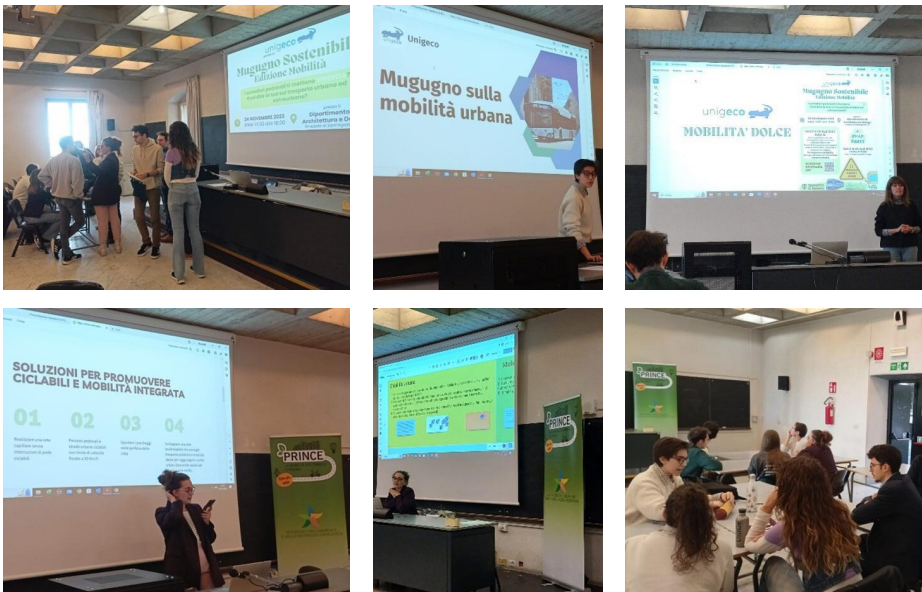
Figura 8 - Evento “Mugugno sostenibile” promosso da associazione Unigeco con il supporto di UniGe Sostenibile.

sotto la guida dell'Associazione studentesca Unigeco. Il nome dell'evento è stato “ Mugugno sostenibile-edizione mobilità ” ed in contemporanea è stato organizzato un altro Swap Party ( https://unigesostenibile.unige.it/mugugno_sostenibile23 , Figura 8).