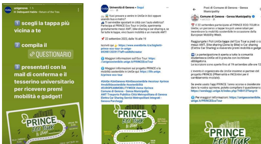
Figura 2 - Esempi di azioni di comunicazione e ingaggio

Tra gli eventi organizzati nell'ultimo periodo, nel 2023, si ricorda la "Mobilità sostenibile per la comunità UniGe: progetti e proposte" , una giornata promossa in occasione del Festival dello Sviluppo Sostenibile 2023, con l'obiettivo di parlare di mobilità sostenibile e anche di cogliere eventuali criticità da affrontare nella programmazione successiva di Ateneo. L'equipe docente ha avuto un ruolo nella sensibilizzazione e formazione promuovendo un confronto con la comunità studentesca, grazie alla collaborazione dell'Associazione studentesca Unigeco. Hanno partecipato all'evento in aula 25 persone fra comunità studentesca e docenti oltre alla Mobility Manager di Ateneo e alla Prorettrice alla Sostenibilità. In contemporanea all'incontro, all'ingresso della struttura ospitante l'evento, sono stati allestiti un banchetto per la promozione del car sharing, con distribuzione di premi mobilità a cura del partner di progetto Car Sharing , e uno Swap Party , organizzato dall'Associazione studentesca Unigeco per promuovere i principi dell'economia circolare. Dettagli sul programma degli interventi e fotografie dell'evento sono disponibili sul sito https://unigesostenibile.unige.it/mobilitafestival23 . In questa fase si assiste quindi ad una maturazione del processo, il coinvolgimento con attori esterni, i partner di PRINCE, e una prima iniziativa promossa dalla comunità studentesca (Figura 3).