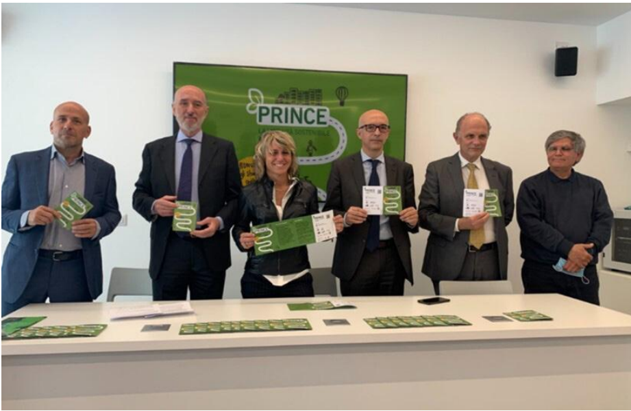
Figura 1 - Evento lancio pubblico dell'APP PRINCE.

Uno dei primi eventi pubblici è stato quello di presentazione avvenuto nel 2022 dove i partner di progetto, attori interni docenti e personale tecnico-amministrativo e attori esterni, hanno proposto l'iniziativa alla cittadinanza, sottolineando quanto la mobilità universitaria giochi un ruolo importante nella mobilità urbana e quindi siano necessarie azioni sempre più sostenibili (Figura 1).