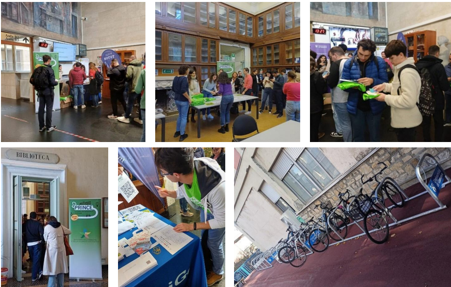
Figura 7 - PRINCE Eco-Tour in UniGe continua...: inaugurazione delle rastrelliere.

sotto la guida dell'Associazione studentesca Unigeco. Il nome dell'evento è stato “ Mugugno sostenibile-edizione mobilità ” ed in contemporanea è stato organizzato un altro Swap Party ( https://unigesostenibile.unige.it/mugugno_sostenibile23 , Figura 8).