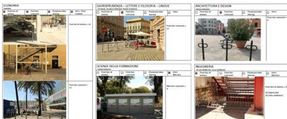
Figura 6 - Estratti di mappatura di rastrelliere e servizi bici esistenti in UniGe.

La seconda edizione dell' Eco Tour , oltre ad incentivare la comunità studentesca al cambiamento delle abitudini di mobilità e all'utilizzo di forme di mobilità sostenibili, ha avuto lo scopo di raccogliere pareri rispetto all'uso della bici come mezzo di trasporto per gli spostamenti Casa-Università e sulla situazione presso sedi differenti (Ingegneria a Via Opera Pia, Ingegneria a Villa Cambiaso, Scienze a Viale Benedetto XV, Farmacia in Corso Gastaldi).