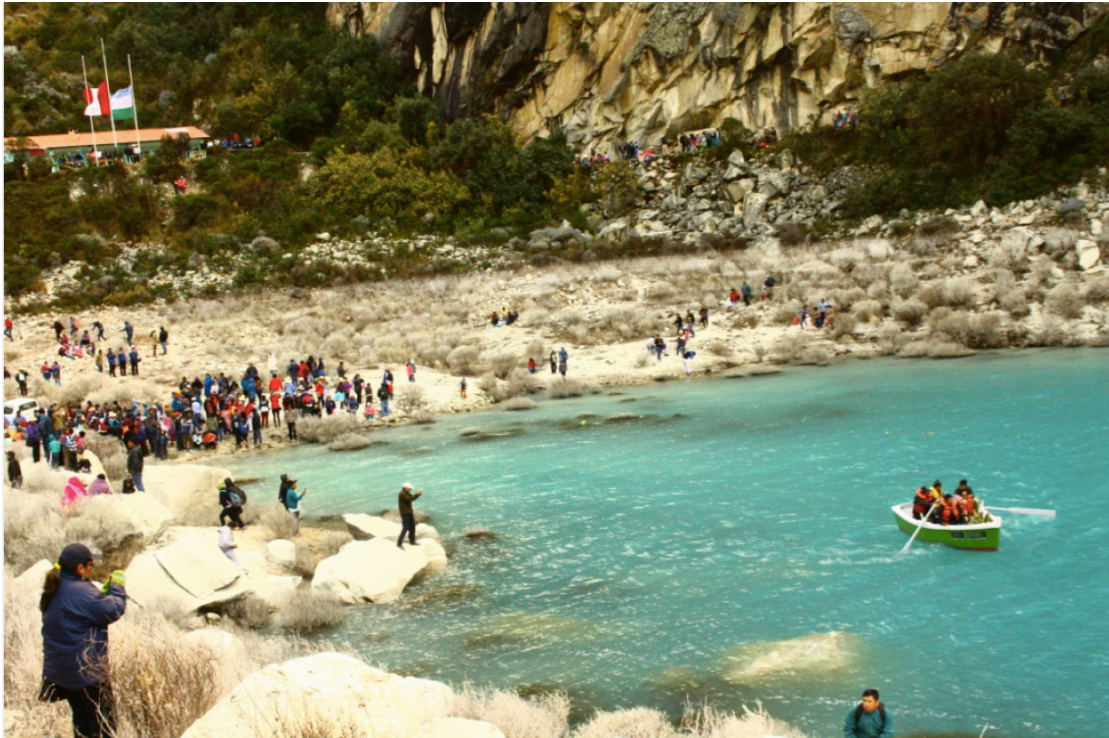
Tavola 11: Rito del “ pago del agua ”, avvenuto il 29 luglio 2016, che evoca la leggenda della creazione del lago Parón. Sulla destra si nota la barca che si dirige verso il centro del lago, con a bordo i personaggi principali della leggenda, per offrire in dono frutta e fiori.