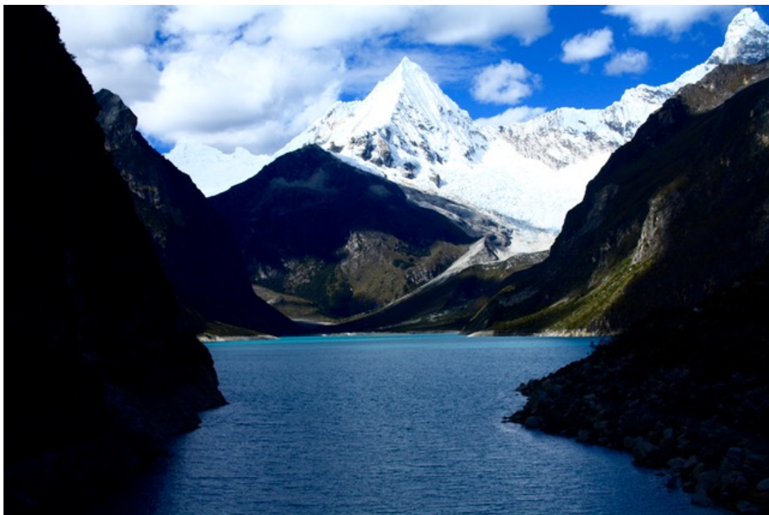
Tavola 2: il lago glaciale Parón visto dal lato sud-occidentale nel luglio 2016. In questo scatto il livello dell'acqua è risalito attorno ai 4185 m.s.l.m. In quel periodo, nonostante l'acqua non venisse convogliata verso gli impianti idroelettrici della Duke Energy, la siccità provocò tuttavia un costante abbassamento del suo livello. Foto: Fabio Azzolin, 2016.