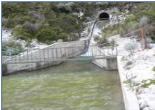
Tavola 4: Vista dell'uscita della galleria utilizzata per la regolazione del lago Parón.