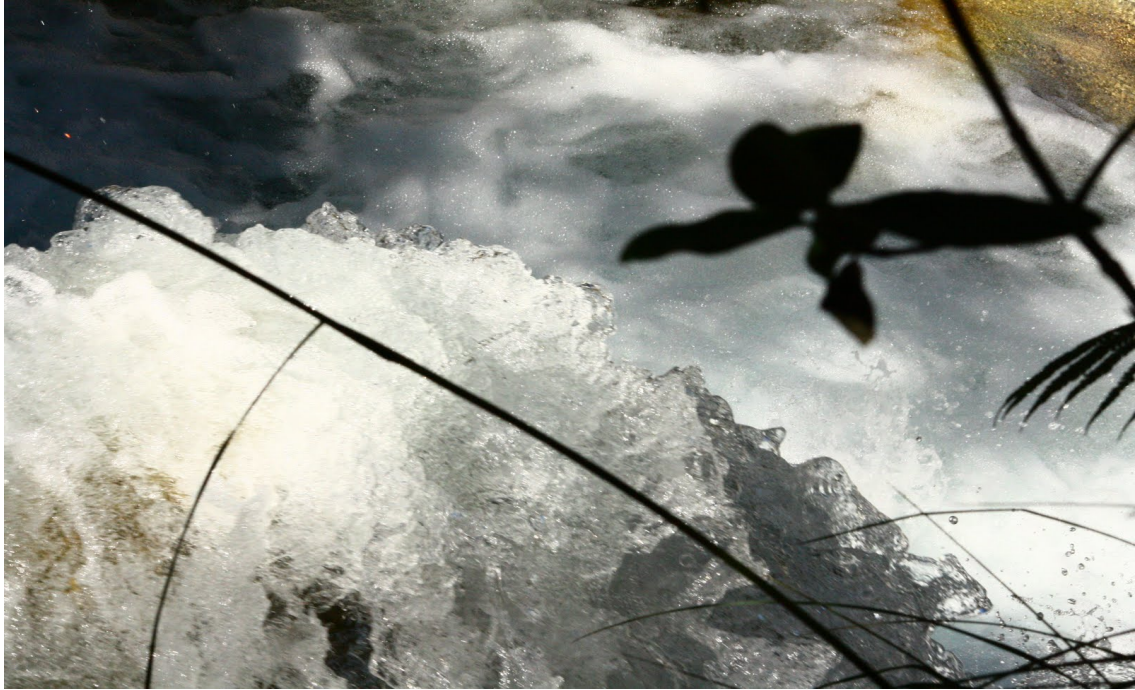
Tavola 6: Macro sul corso d'acqua che scende lungo la vallata Parón Llullán e che si insinua all'interno di una rigogliosa area boschiva. Il torrente scende a valle per confluire con il Río Santa, che attraversa da sud a nord l'intero Callejón de Huaylas per poi volgere a ovest prima di entrare nel Cañon del Pato e scendere fino a sfociare nell'Oceano Pacifico, a nord della città di Chimbote.