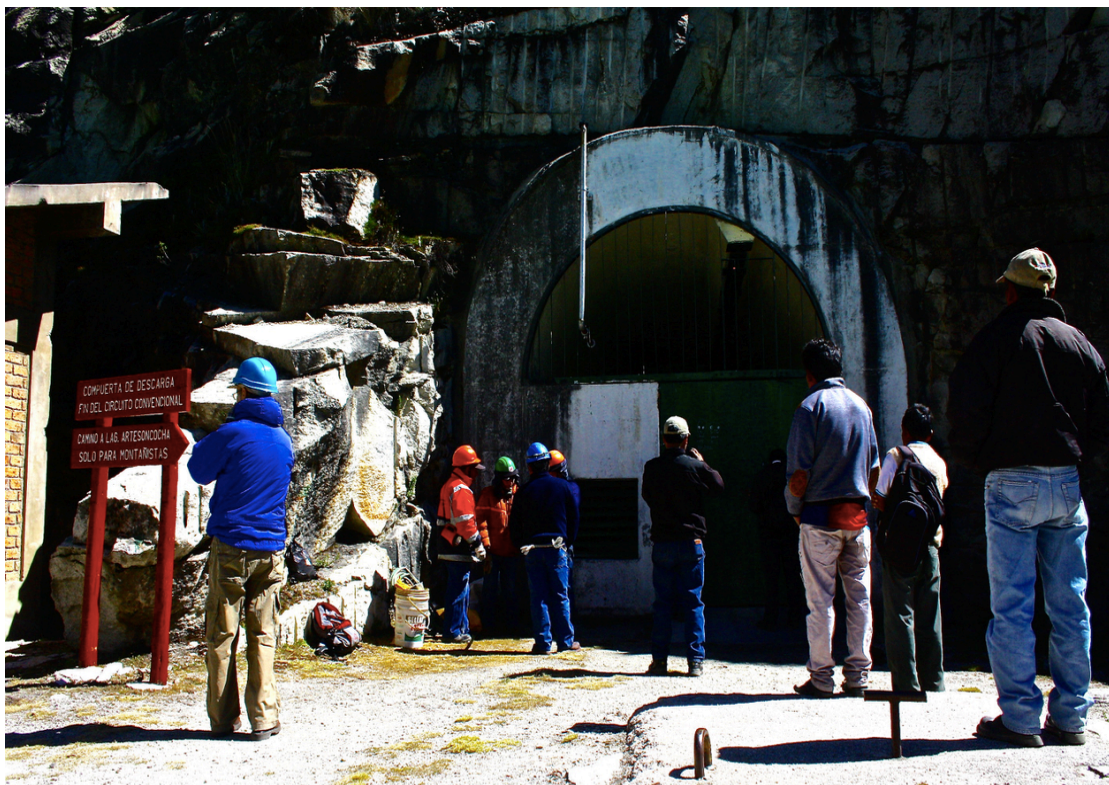
Tavola 10: Ingeniero, obrero e campesino in attesa sull'uscio dei locali dell'impianto per le manovre di regolazione delle paratie subacquee che controllano il deflusso dell'acqua del lago Parón. Foto: Ibidem , 23 giugno 2016.