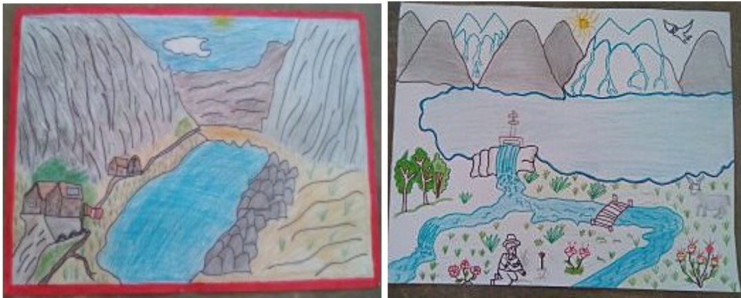
Tavola 7 e 8: Due disegni, che ritraggono il lago Parón, entrambi realizzati da un gruppo di ragazzi della scuola di Llacshu per il concorso indetto dalla CEAS. Foto: Ibidem , 2016.