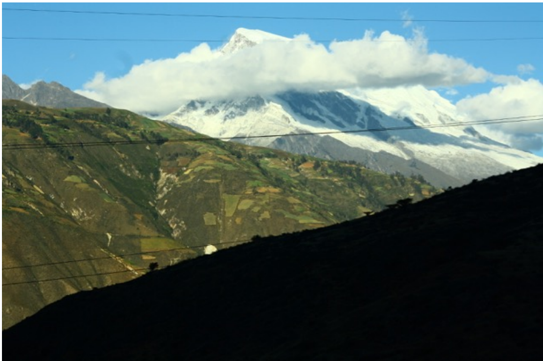
Tavola 12: Paesaggio tipico del Callejón de Huaylas osservato dalla Cordillera Negra; in lontananza si scorge il picco innevato del Huascarán.