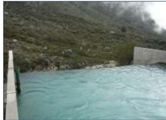
Tavola 5: Vista del canale a pelo libero attraverso il quale prosegue il deflusso dell'acqua del lago.