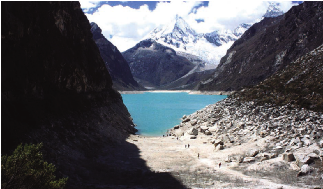
Tavola 1: il lago glaciale Parón visto dal lato sud-occidentale, prima del 2008. A causa dell'insostenibile sfruttamento del lago, nell'agosto 2008 il livello dell'acqua raggiunse livelli estremamente bassi.