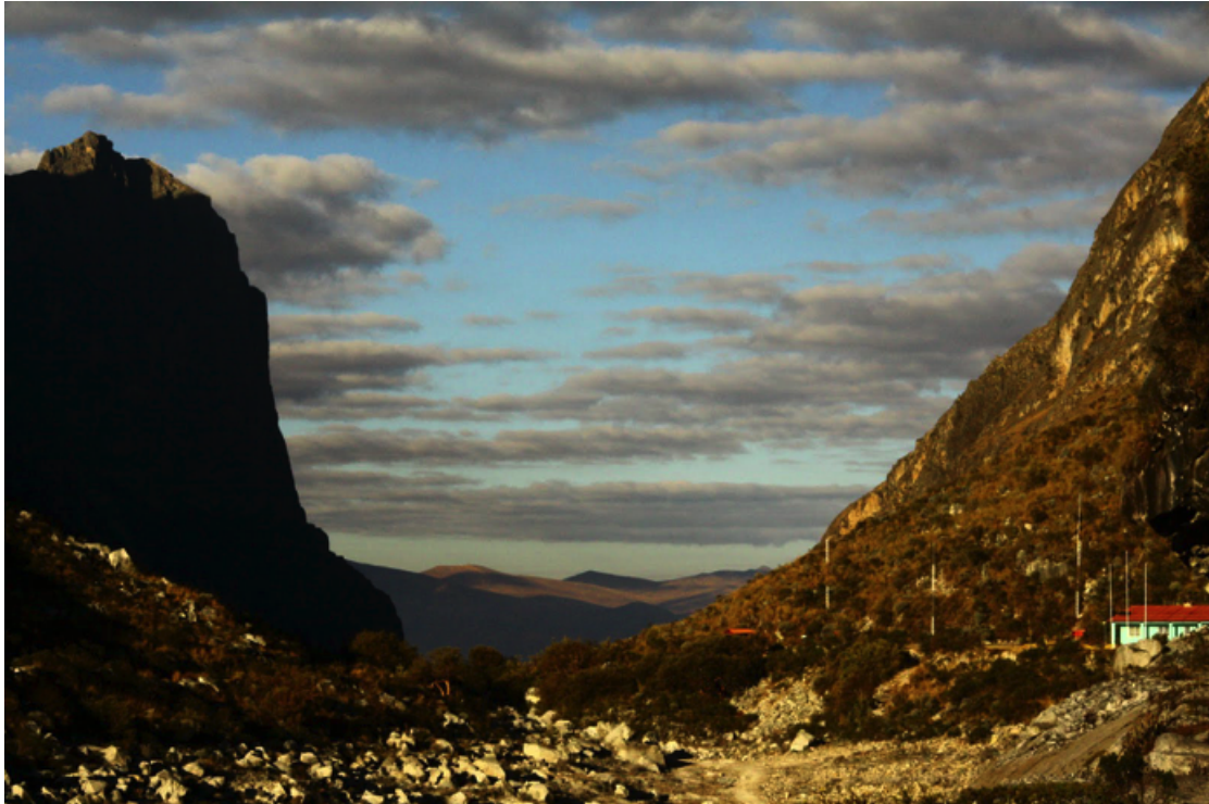
Tavola 3: Pianoro che precede il lago Parón, che si trova alle nostre spalle. In basso a destra si può notare il presidio dell'impianto della compagnia idroelettrica, occupato all'epoca – 2011 – da due guardiani pro-tempore nominati dalla comunità Cruz de Mayo.