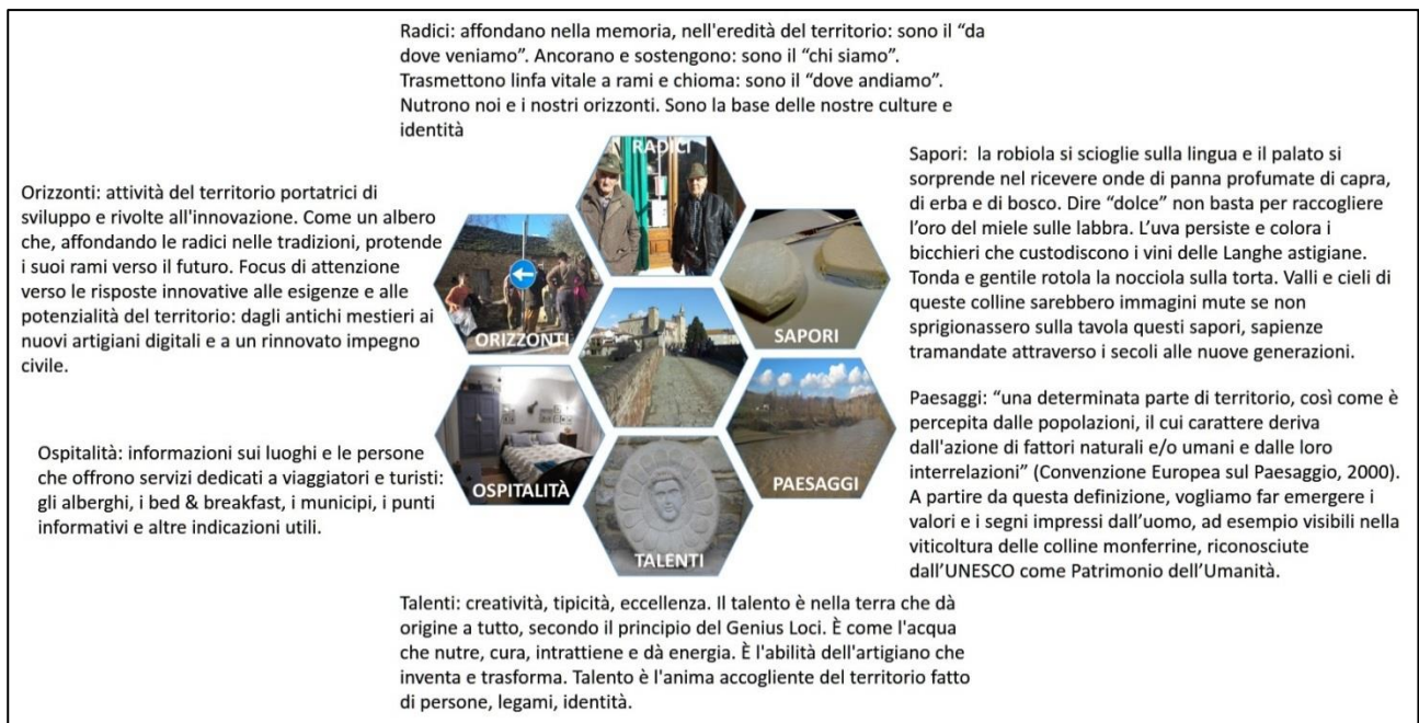
Figura 3. I nuclei tematici della mappa esperienziale di Monastero Bormida.