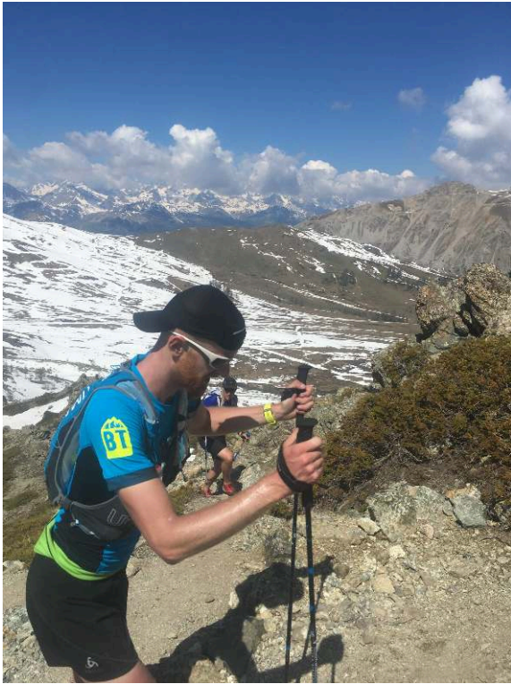
Représentations photographiques des blogueurs